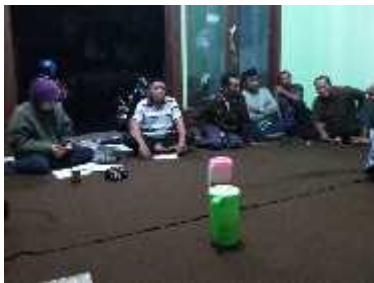
Gambar 1. Pertemuan Rutin Anggota Kelompok Tani Sidodadi

Dari ungkapan anggota kelompok tani Sidodadi menunjukkan bahwa ketua kelompok tani Sidodadi menyampaikan informasi mengenai program dan bantuan dari pemerintah pada saat pertemuan rutin kelompok. Selain dari ungkapan ketua dan anggota kelompok tani Sidodadi, dari hasil pengamatan peneliti mengikuti kegiatan kelompok tani Sidodadi peneliti mendapati ketua kelompok tani menyampaikan informasi mengenai program dan bantuan pemerintah yang diberikan oleh pemerintah. Kegiatan pertemuan rutin kelompok tani Sidodadi dapat dilihat pada Gambar 1.